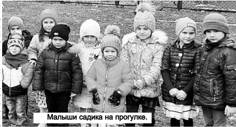
Малыши садика на прогулке.